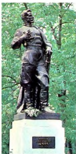
Старый памятник Щорсу