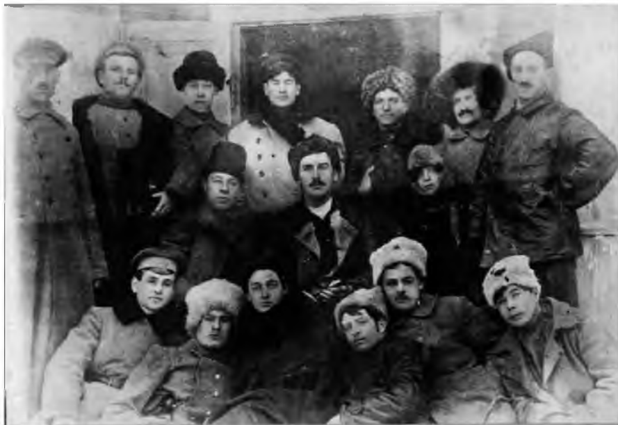
Руководство Богунского полка. 1918 год

Богунский полк был сформирован из уже существующих повстанческих групп и отрядов, которые со всех сторон стекались в Унечу, а также из местных жителей-добровольцев.