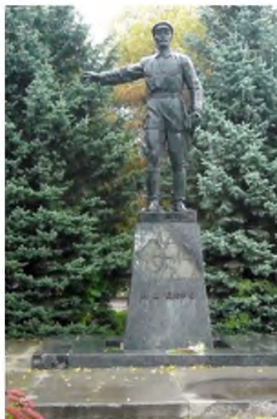
Новый памятник Щорсу