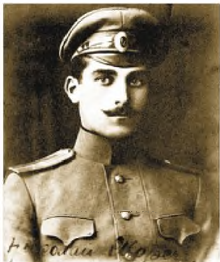
Офицер Русской Императорской армии Н. Щорс